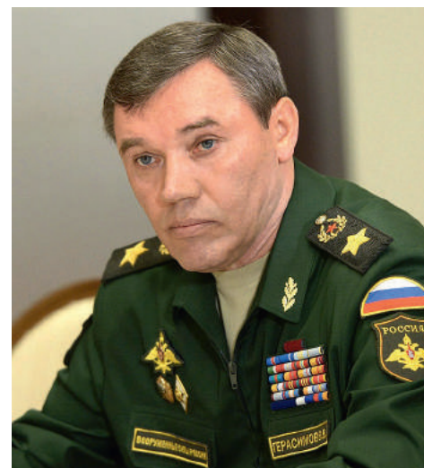
▶ Der russische General Valeri Gerassimow.