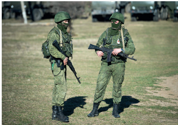
▲ Die «grünen Männchen» – Soldaten ohne Hoheitsabzeichen – waren bei Russlands Annektierung der Krim omnipräsent.