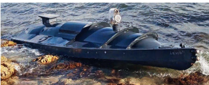
◀ Ein bereits im September 2022 auf der Krim gestrandetes USV der Ukraine. Mit solchen unbemannten Drohnen sollen am 29. Oktober 2022 russische Kriegsschiffe im Marinestützpunkt von Sewastopol angegriffen worden sein.

Seither wird festgestellt, dass die Aktivitäten der Schwarzmeerflotte beträchtlich zurückgefahren worden sind, dass Einheiten zwar in Sewastopol verbleiben und damit die Gefahr von Abschüssen der ballistischen Lenkwaffen des Typs «Kalibr» eher zurückgehen, dass auch amphibische Landeaktionen derzeit eher unwahrscheinlich sind und dass aber Russland mehrere Einheiten – offenbar aus Respekt vor weiteren ukrainischen Angriffen dieser Art – von Sewastopol ins östlich gelegene Novorossiysk