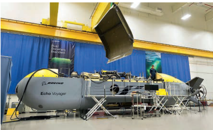
◀ Auch die USA entwickeln eine Vielzahl von unbemannten Systemen für verschiedenste Einsatzzwecke, wie hier die UUV «Orca» für die Navy.