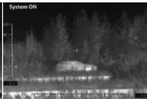
Adaptives Tarnsystem zur Täuschung im infraroten Spektrum.