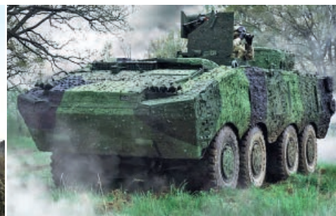
Beispiele von mobilen Tarnnetzen auf einem Raupenfahrzeug (SSZ) und Radfahrzeug (Saab).