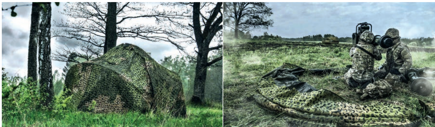
Tarnung einer Panzerabwehrstellung mit multispektralen Tarnnetzen.

zu verringern. Dazu gehören neben weiterentwickelten passiven Tarntechnologien (etwa Tarnnetze, radarabsorbierende Oberflächen, Schalldämpfung) auch aktive Systeme zur Auswertung und Beeinflussung des elektromagnetischen Spektrums. Mit den beiden Firmen Saab (Thun) und SSZ (Zug) verfügt die Schweiz bereits über die notwendige Industriebasis, um zeitnah bestehende Lücken zu schliessen und auch zukünftig die technologische Weiterentwicklung für die Schweizer Armee sicherzustellen.